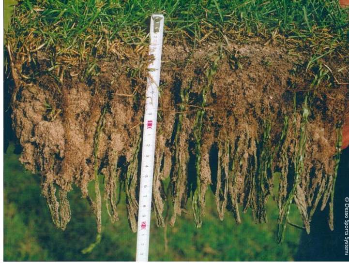
(fotoğraf: doğal çim köklerinin Desso GrassMaster lifleri ile kaynaşması)

Suni lifler saha yüzeyinde kolayca görünmez, Desso GrassMaster ilk görüşte % 100 doğal çim yüzeyi şeklinde görünür.